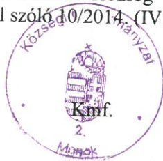
Demeterné Bártfay Emese. polgármester